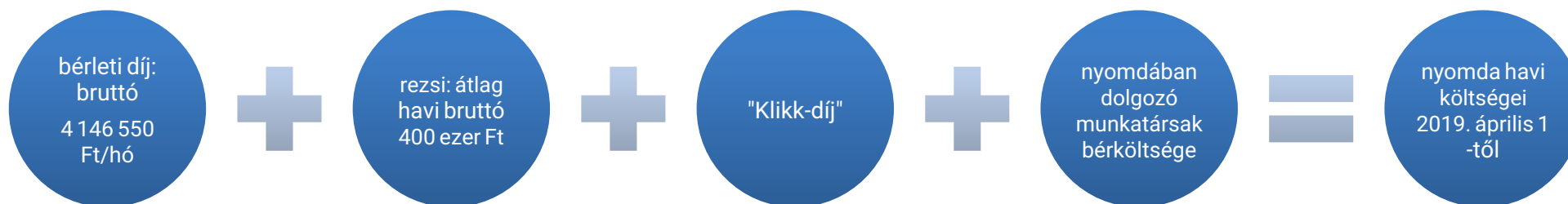
2. számú ábra: A nyomda havi költségei 2019. április 1-től